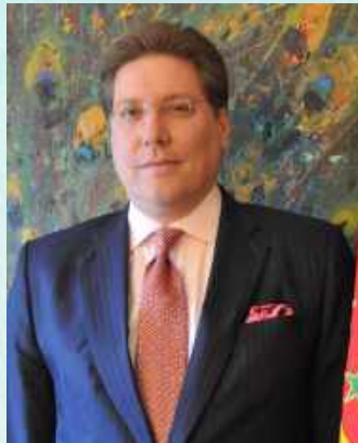
ATTORNEY AT LAW CONSUL OF THE COMMONWEALTH OF DOMINICA